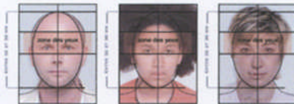
CONFORME À LA NORME ISO/IEC 19794-5 : 2005